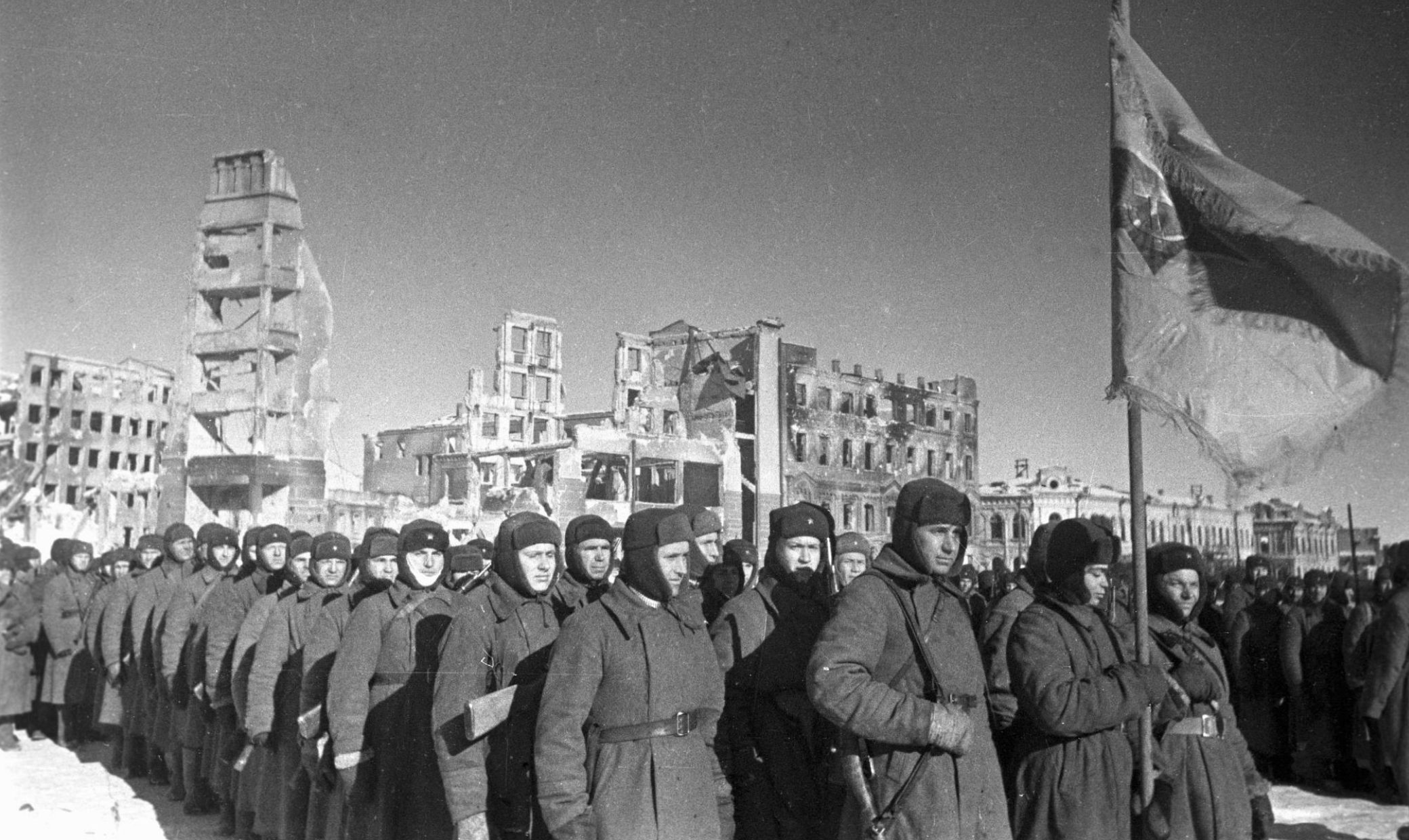
ОБОРОНИТЕЛЬНЫЙ ЭТАП 17 июля — 18 ноября 1942 г.