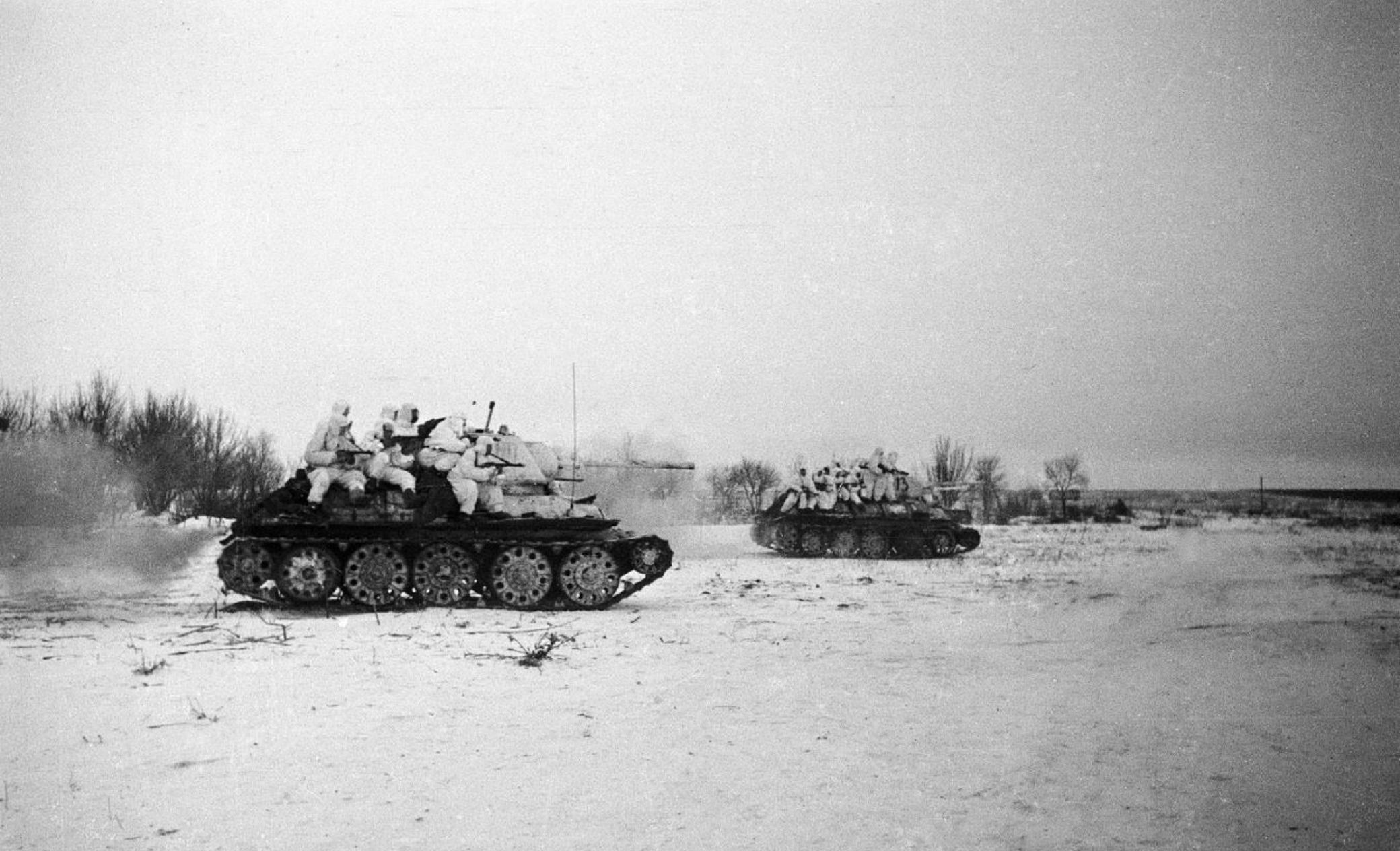
Рейд на Тацинскую (декабрь 1942 г.) – 24-й танковый корпус В. М. Баданова уничтожил немецкий аэродром, осложнив снабжение окружённых войск.