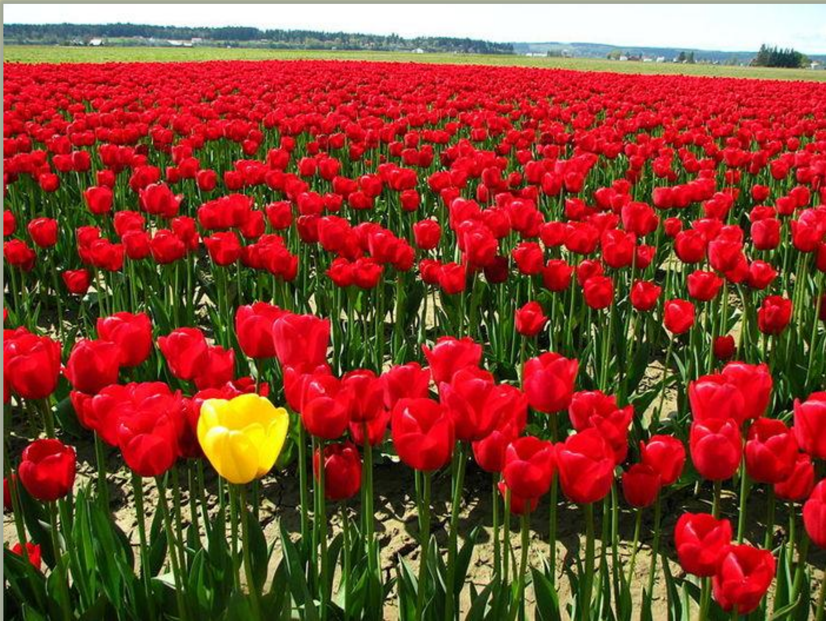
Новозизевская тюльпанная степь в Дергачевском районе