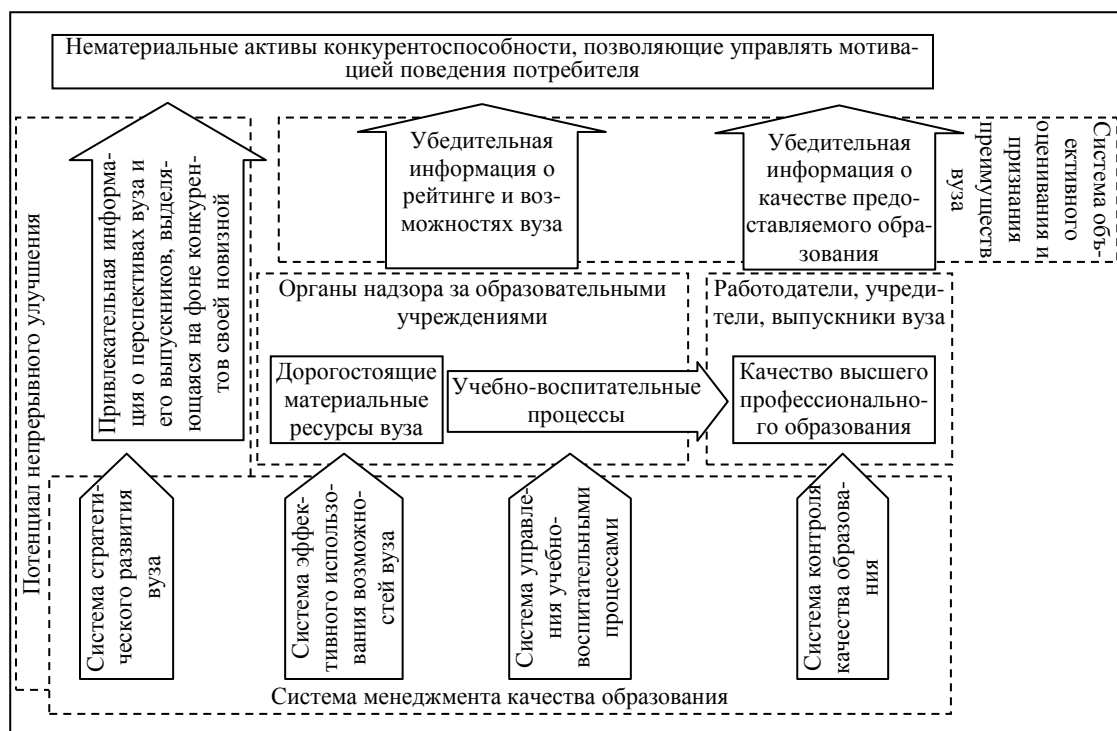
Рис. 2. Модель управления факторами конкурентоспособности

Анализ методов управления факторами конкурентоспособности выполнен на основании модели, представленной на рисунке 2.